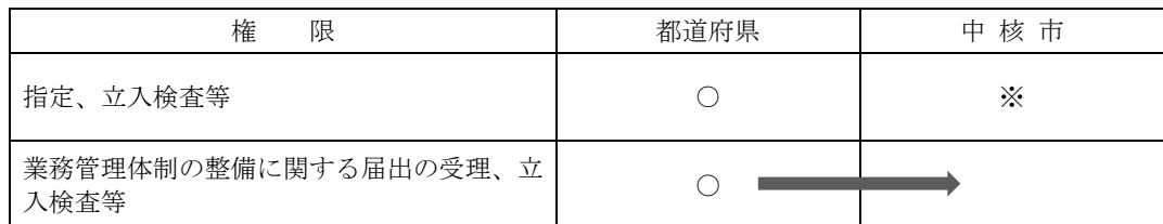
図2 都道府県から中核市への指定障害児通所支援事業者の業務管理体制の整備に関する届出の受理、立入検査等の事務・権限の移譲