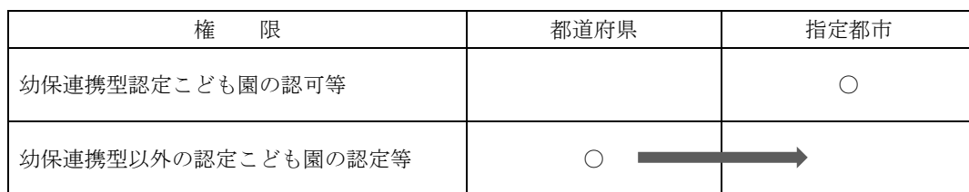
図1 都道府県から指定都市への幼保連携型以外の認定こども園の認定権限の移譲

型及び地方裁量型の認定こども園)の認定等の事務・権限を、指定都市へ移譲することとした。